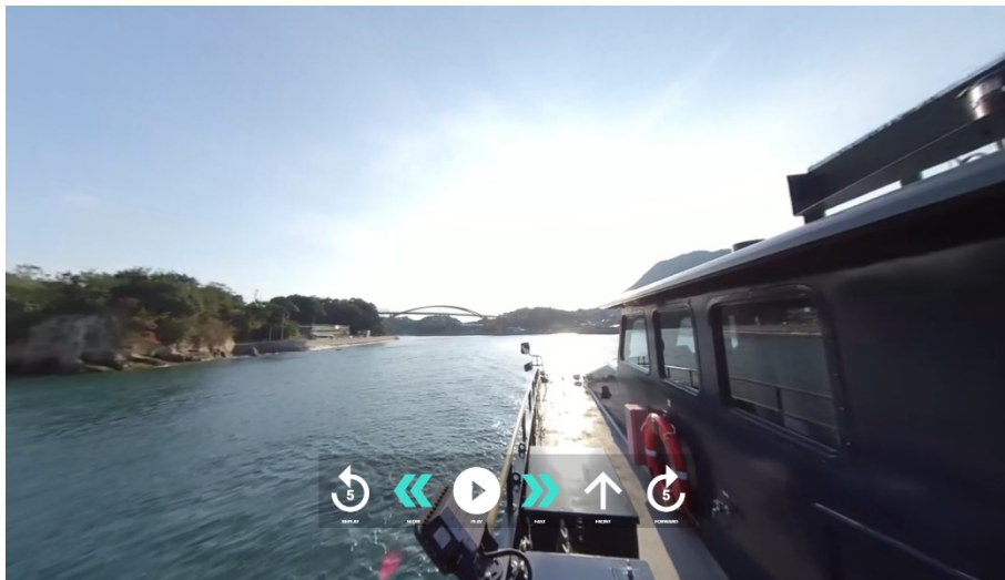
<クルージングの360°動画イメージ> 動画を再生しながら360°視点を動かすことができます

これにより、JR 西日本グループおよび瀬戸内海汽船グループが運航している観光型高速クルーザー「SEA SPICA (シースピカ)」でのクルージングの様子や寄港地である「大崎下島・御手洗地区」、「生口島・瀬戸田地区」周辺の街歩きを、スマートフォンやパソコンのウェブサイトから360°動画で体験することができます。